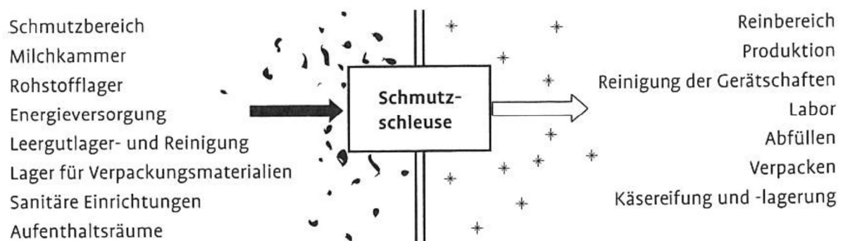
Abbildung 1: unreiner und reiner Bereich